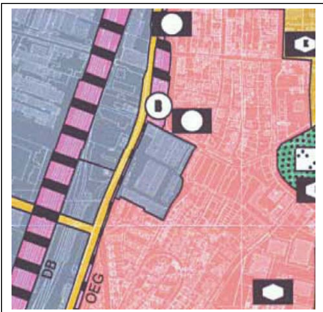
Bisherige Darstellung (ohne Maßstab)