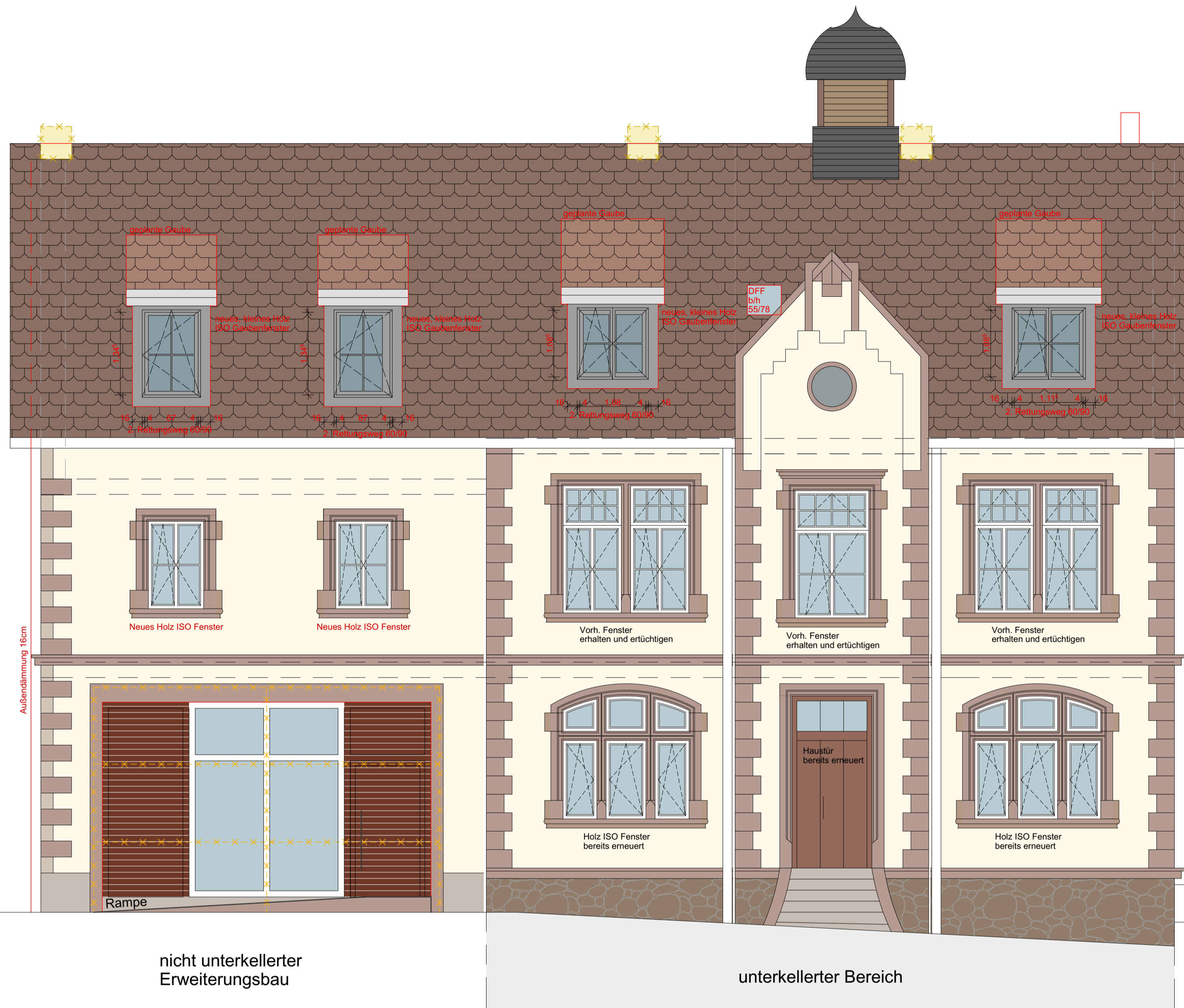
Ansicht Steinklingener Straße (Nordost)